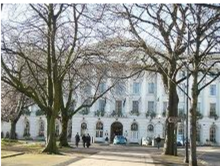
○素敵なホテルでアフタヌーンティーも！ロンドンの半額以下で楽しめます。