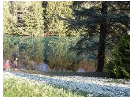
○郊外にウォーキングにでかけます。スノードロップが湖にはえて美しい。