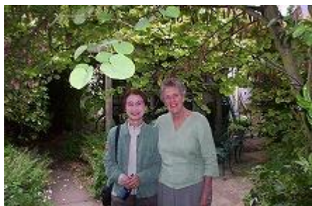
○プライベートガーデンでの一枚。一般家庭のお庭も素敵です。