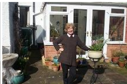
○ヨガの先生をしてるマザー教室にも遊びに行ってみました。