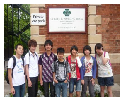
○訪問施設の前でのスナップ