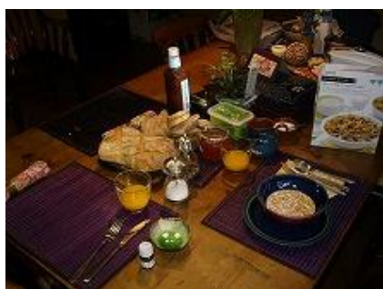
○朝食の様子(家庭により異なる)紅茶やトーストはさすがイギリス！