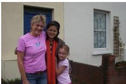
○高校生も一人でステイ参加しました。すっかりファミリーの一員に！