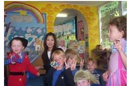
○保育所の子供達と。