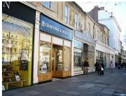
○中心街・ショップも充実しています！キャスケットソックスやティーゼルもあります。