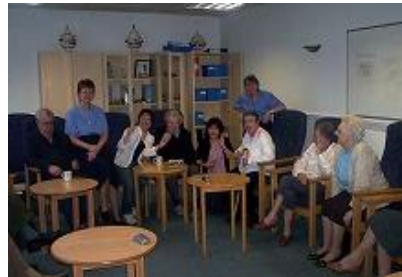
○スタッフに囲まれて緊張します。