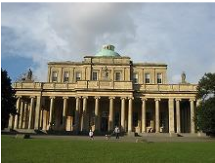
○ポンプ場(温泉)街の発展の要でした。今でも飲む温泉を経験出来ます！

チェルトナムは、温泉が出たことから保養地として栄えてきました。その為、文化面もとても充実した穏やかな街です。中心街にはショップも充実しており、おしゃれなホテルでアフタヌーンティーも楽しめます。