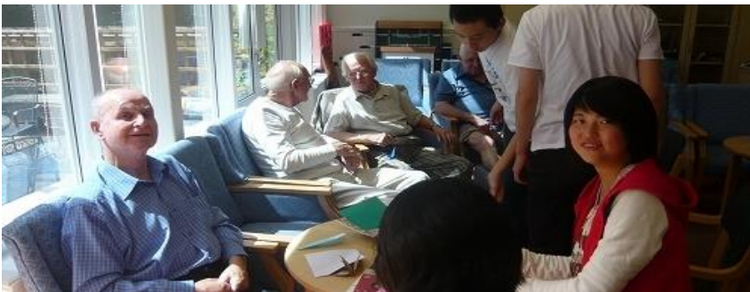
○利用者の方達との英語での会話は、話題作りに一発懸命。英語も大切です。