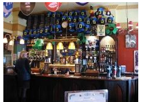
○パブでのランチもおいしい！くつろげる良いパブもたくさん。