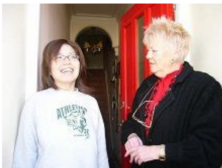
○カレッジに通う宿泊先としても便利！ファミリーともすっかり仲良く。