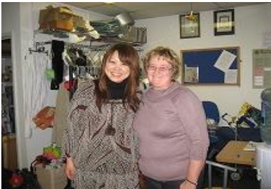
○現地の方と仲良くなりました。

語学留学などでは、なかなか経験できない、現地の福祉・保育施設への訪問体験です。地元の方達との交流出来る場としても、とてもよい機会となりますので、積極的にコミュニケーション下さい。