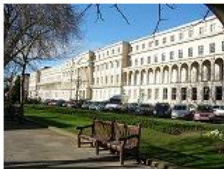
○観光案内所などの建物です。ホテルを思わせるような外観です。