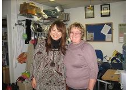
○笑顔が素敵です。この地域の方はやさしい人が多い！