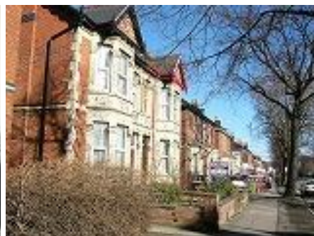
○チトナムの住宅街:とても閑静な住宅街で治安もとてもよいです。