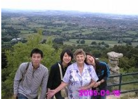
○郊外の展望ポイント(丘)からほんとうに美しい地域です。